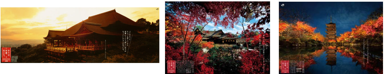
過去CM・ポスターイメージ

また過去のTVCMをYoutubeの公式アカウント上にアーカイブします（※）。その他、オフィシャルサイト・SNSにて25周年を振り返る特別コンテンツを公開するなど、順次京都の秋の魅力を発信していきますので、ぜひご覧ください。