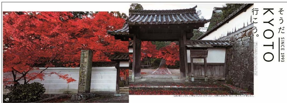
B0×2連ポスター <一休寺ポスタービジュアル イメージ>