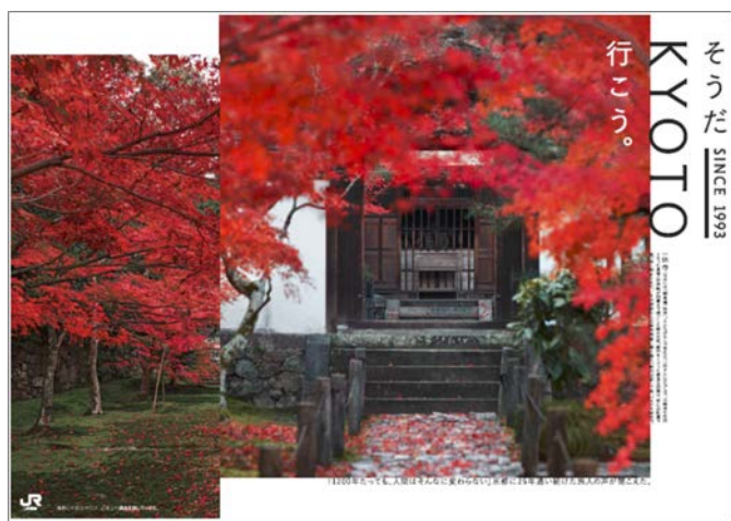
B0ポスタービジュアル

【期 間】 2018年10月1日(月)～順次 【掲出箇所】 首都圏・静岡地区・名古屋地区の主な駅、および京都駅