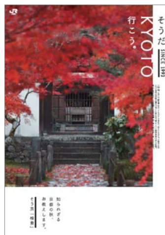
B1ポスタービジュアル