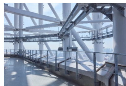
SKYTREE TERRACE TOURS