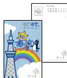
オリジナルポストカード