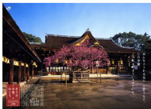
【2009年初春 北野天満宮のポスター】

○これまでさわやかウォーキングのコースでお立ち寄りいただいた名所のうち、「そうだ 京都、行こう。」キャンペーンでも舞台となった北野天満宮等のポスター、そして「さわやかウォーキング@関西」のあゆみを北野天満宮で展示します。あらためて京都の魅力をお楽しみください。