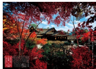
【2015年秋 北野天満宮のポスター】

○累計参加者500万人達成記念コースの特典として、ゴールにて先着1,500名様に「オリジナルポーチ」をプレゼントいたします。