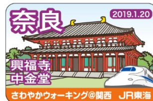
【オリジナルバッジ】