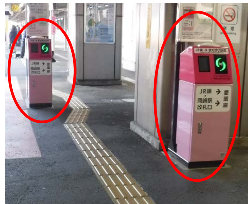
I C のりかえ改札機