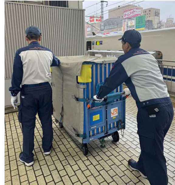
②駅でのお荷物の輸送イメージ