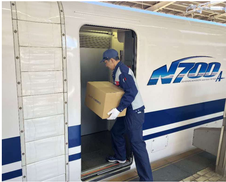
①お荷物の積み下ろしのイメージ