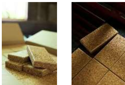
モクロックの製品写真