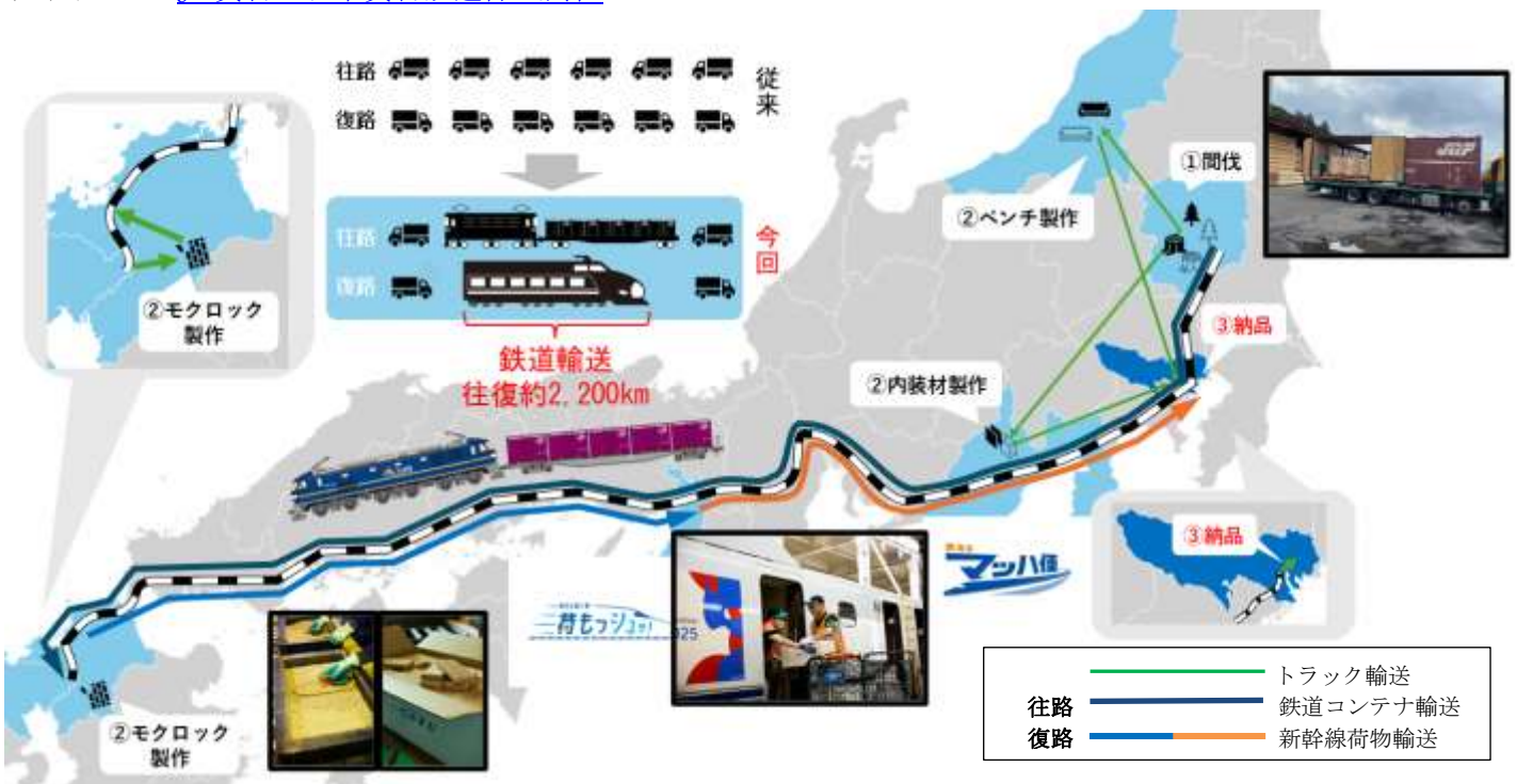
輸送全体図 (イメージ)