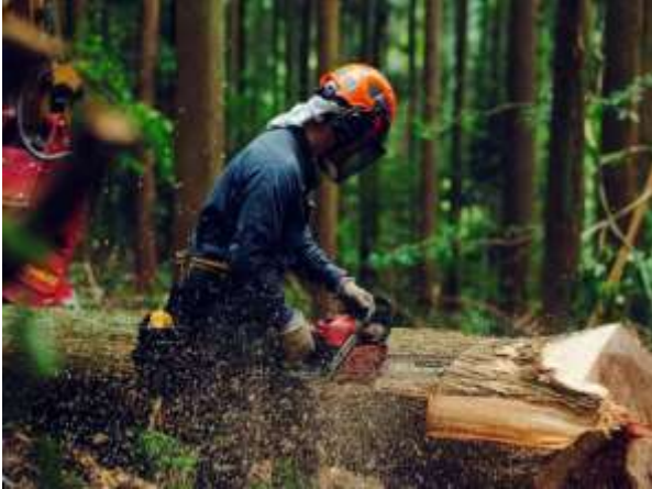
△社有山林の間伐材(イメージ)

北千住駅のリニューアル工事では、東武鉄道の社有山林で切り出された間伐材を、駅のベンチ等に使用しました。間伐材を産出した社有山林では、間伐のほか下刈り・枝打ちなど適正な管理が施されており、この管理により吸収されたCO 2 について、経済産業省が所轄する国内クレジット制度で認証され、J-クレジットとして流通することができます。