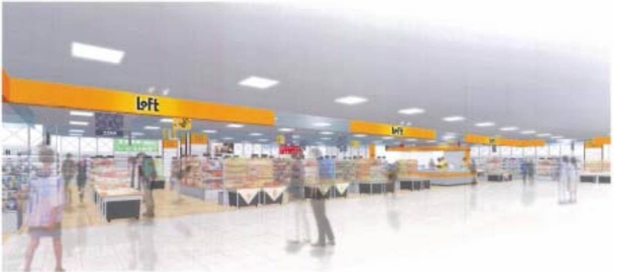
ロフト：店舗イメージ