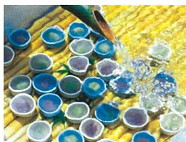
大垣特産の水まんじゅう(イメージ)