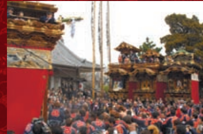
乙川駅・乙川祭り