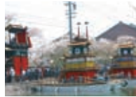
半田駅・上半田地区のちんごろ祭