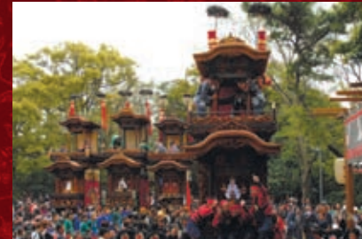
東成岩駅・成岩地区の山車