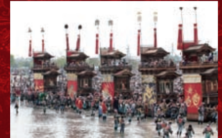
亀崎駅・亀崎潮干祭