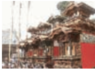
乙川駅・乙川祭り