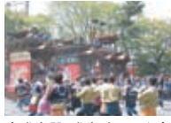
東成岩駅・成岩地区の山車