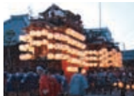
半田駅・宮宮の山車