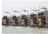
亀崎駅・亀崎潮干祭