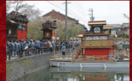
半田駅・上半田地区のちんごろ祭

主催:半田市観光協会 共催:JR東海 協力:半田市・半田山車祭り保存会・亀崎潮干祭保存会