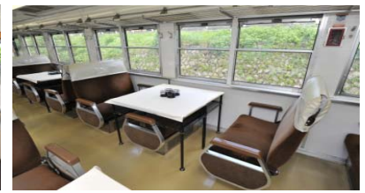
1・3・4号車内イメージ