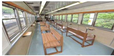
2号車(ウィンディスペース)車内イメージ