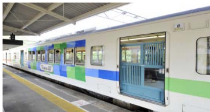
2号車(ウィンディスペース)外観

1・3・4号車…大型のテーブルを配置し、ゆったりとしたスペースで飲食等を楽しめます。