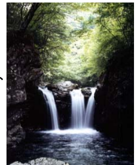
※小坂の滝の一つ 三ツ滝