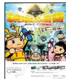
ポスターイメージ