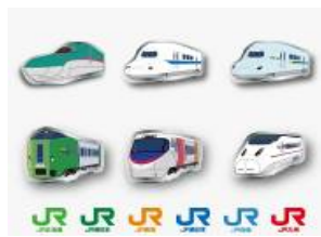
ピンバッジセット(イメージ)

モバイルラリー告知B1ポスターをJR各社の主な駅で掲出いたします。掲出時期は2011年7月28日（木）以降を予定しております。