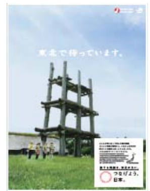
イメージ(三内丸山遺跡)