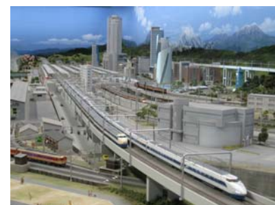
鉄道ジオラマ（イメージ）