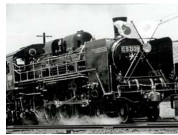
C57形式蒸気機関車（お召列車）