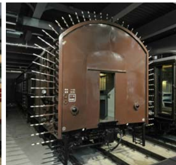
オヤ31形式建築限界測定車