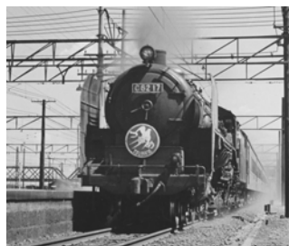
C62形式蒸気機関車（つばめ）