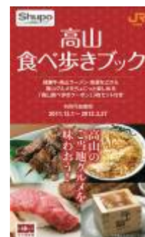
高山食べ歩きブック（イメージ）