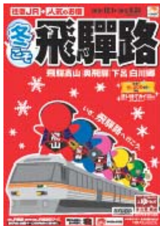
パンフレット（イメージ）

・おひとり様の基本代金に片道500円増（おとな・子ども同額）で、ひだ号のグリーン車が利用可能！