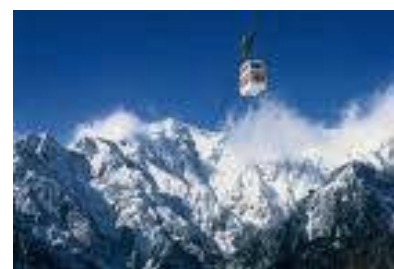
新穂高ロープウェイ（イメージ）