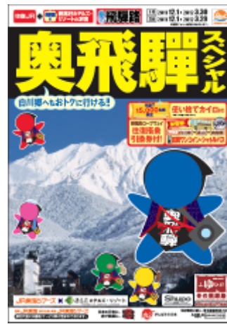
パンフレット（イメージ）