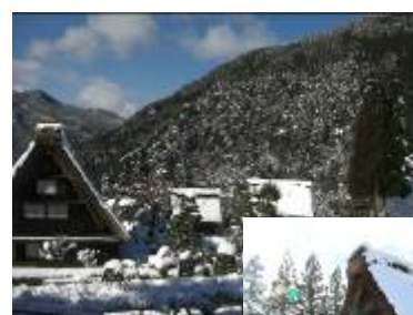
下呂温泉合掌村 （イメージ）