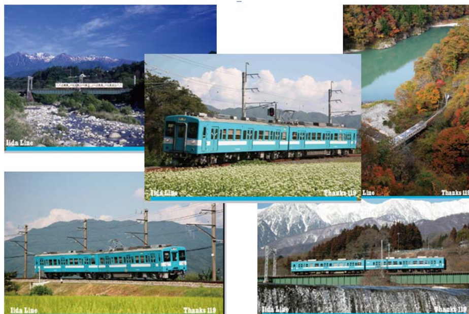
記念乗車券に付く絵ハガキ(5枚) (実際に同封する写真イメージと異なる場合がございます)