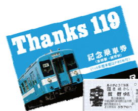
ありがとう119系記念乗車券 〈硬券〉（イメージ）