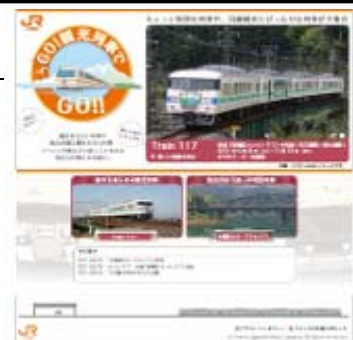
「GO!観光列車でGO!!」ホームページ(イメージ)

http://shupo.jr-central.co.jp/train/index.html