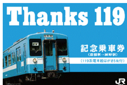
記念乗車券(豊橋から辰野ゆき) 〈台紙〉(イメージ)