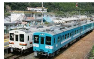
ありがとう119記念号 （写真右側・イメージ）

3月31日（土）までの「ありがとう119ウィークス」期間中、その他にも臨時列車の運転やイベント等を予定しています。詳細については、決まり次第お知らせいたします。