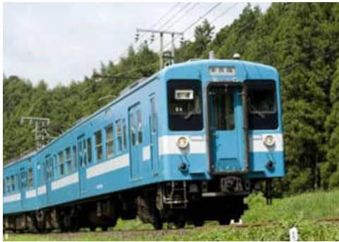
ありがとう119記念号 (イメージ)