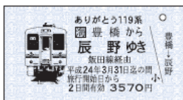
記念乗車券(豊橋から辰野ゆき) 〈硬券〉(イメージ)