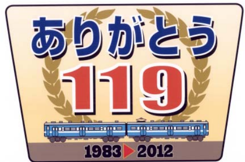
ヘッドマーク (イメージ)