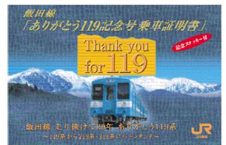
乗車証明書 (イメージ)