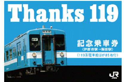
記念乗車券(伊那市から飯田ゆき) <台紙>(イメージ)