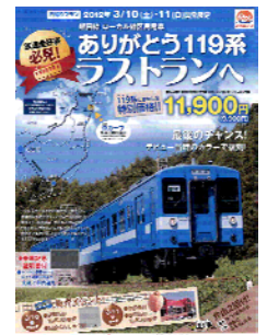
パンフレット(イメージ)