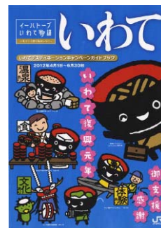
キャンペーンガイドブック