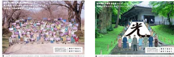
駅掲出ポスター(イメージ)