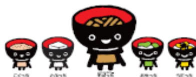
キャンペーンキャラクター「わんこきょうだい」