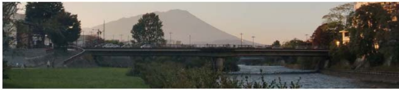
車内吊り(窓上)ポスター(イメージ)