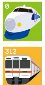
「TRAIN マグネット」 (イメージ)