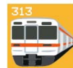
「TRAIN マグネット」 (イメージ)