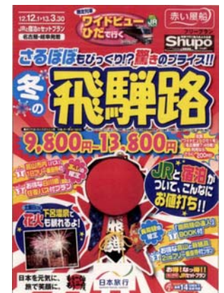
パンフレット（イメージ）

問合せ先：日本旅行 名古屋予約センター (Tel 0120-230-066、052-855-2277) 月曜日～金曜日 10:00～19:00