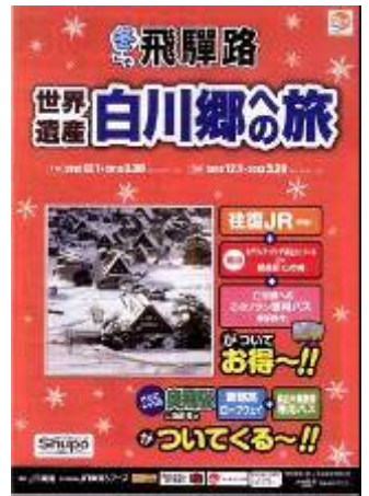
パンフレット（イメージ）