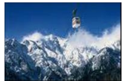
新穂高ロープウェイ（イメージ）