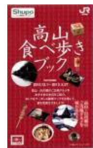
高山食べ歩きブック（イメージ）