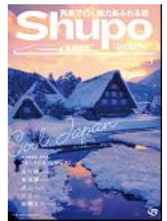
名古屋地区のJRの 主な駅で配布予定の冊子 「Shupo」（冬版）（イメージ）