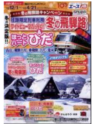
パンフレット（イメージ）

問合せ先：JTB東海 中部旅の予約センター (Tel 052-566-2030) 9:30～21:00