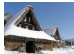
五箇山民俗館 （イメージ）