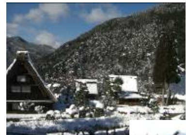
下呂温泉合掌村 （イメージ）