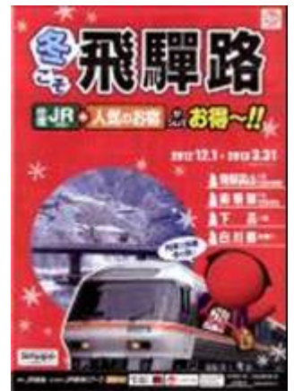
パンフレット（イメージ）

問合せ先：JR東海ツアーズ 名古屋支店 (Tel 052-564-2430) 10:00～17:00 JR東海ツアーズ 旅の通販デスク (Tel 03-3538-4088) 10:00～18:00