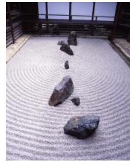
妙心寺 東海庵 書院南庭