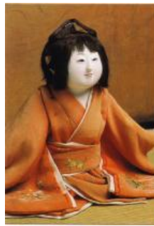
宝鏡寺(孝明天皇御遺愛の御所人形)