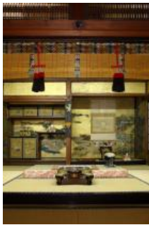
霊鑑寺 書院 上段の間