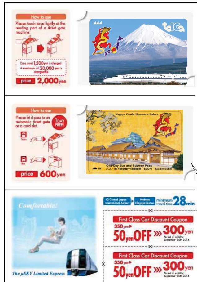
ICカード・1日乗車券装着面デザイン