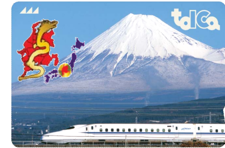
ICカード (TOICA) デザイン