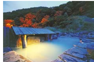
奥山温泉露天風呂