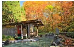
蟹場温泉露天風呂