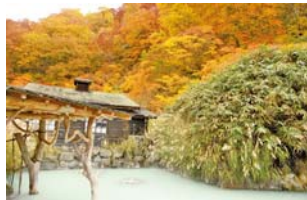
鶴の湯温泉露天風呂