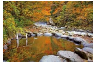
鷹の湯温泉露天風呂