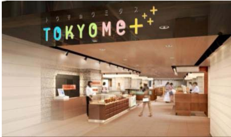
○「パティスリー」ゾーン