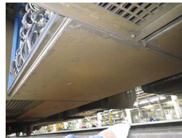
正常な取り付け状態