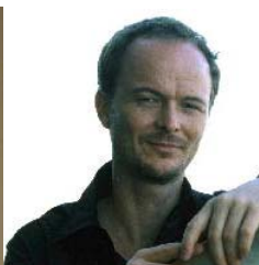
クリストファー・ハーディ (パーカッション)