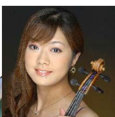
小杉結 (ヴァイオリン)