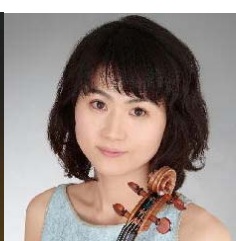
佐原敦子 (ヴァイオリン)