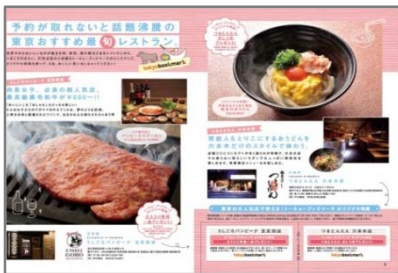
トーキョーおでかけPASS (夏版) 中面イメージ

※詳細は参考資料3(「オリジナルチケット発売対象イベント」一覧表)をご参照ください。