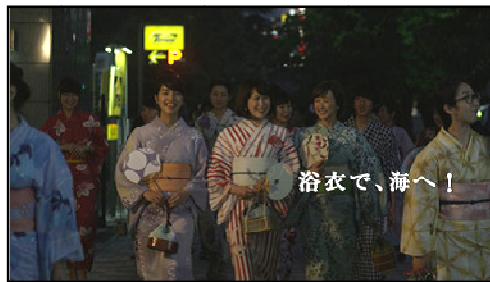
浴衣をレンタルしてウキウキと 「納涼船」に向かう3人