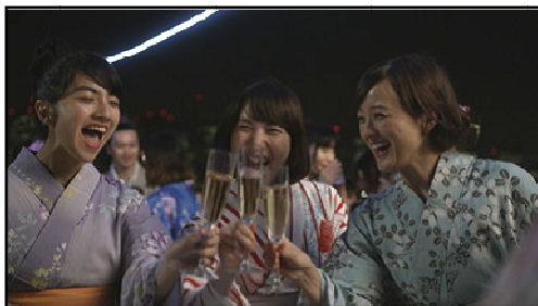
「納涼船」でワイワイ騒ぐ3人 東京湾の船上で「カンパイ！」