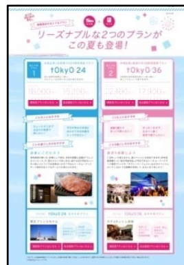
夏の「特別プラン」特集