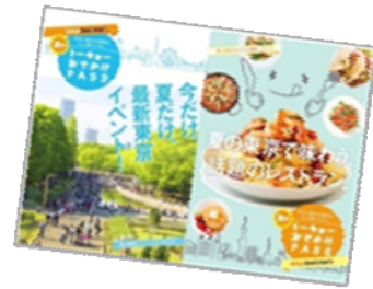
トーキョーおでかけPASS (夏版)

平成26年7月1日(火)出発～平成26年9月30日(火)帰着分のトーキョーブックマークプランの旅行商品(特別プラン・専用プランを含むトーキョーブックマークプラン全商品)を購入された方を対象に、夏の東京を存分に、おトクに楽しめる特典満載のオリジナル冊子「トーキョーおでかけPASS(夏版)」をグループに1冊プレゼントします。