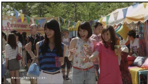
原宿の森（公園）で開催されている フェスを楽しんでいる3人