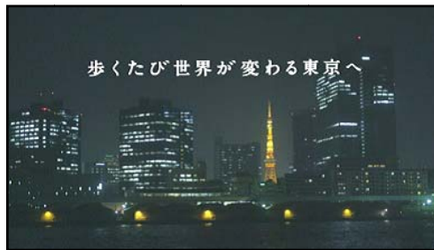
東京の夜景にひと際目立つ「東京タワー」。 「歩くたび 世界が変わる 東京へ」のキャン ペーンコピーとともにラストカットに登場