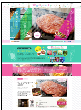
東京の大人気レストランを、 トーキョーブックマーク オリジナル特典とともに紹介