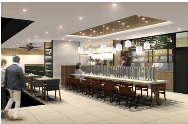
個人利用客向けのテーブル席