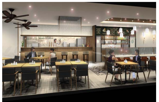
グループ向けのテーブル席（手前） カウンター席（奥）