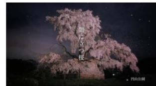
祇園・円山公園（2006年） 「闇に立つ桜」