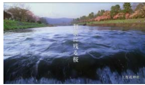
賀茂川（2007年） 「和歌に残る桜」