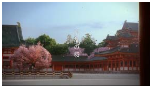
平安神宮（2015年・NEW） 「京都の桜」