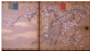
仁和寺（1994年） 「襖絵に残る桜」