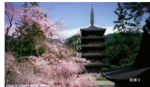
醍醐寺（2009年） 「秀吉の桜」