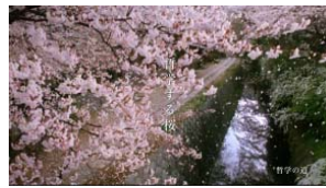
哲学の道（1997年） 「哲学の桜」