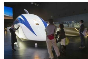
過去のイベントの様子