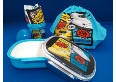
N700系&923形 （手前）ランチボックス （左）お手拭セット （右）ランチ巾着