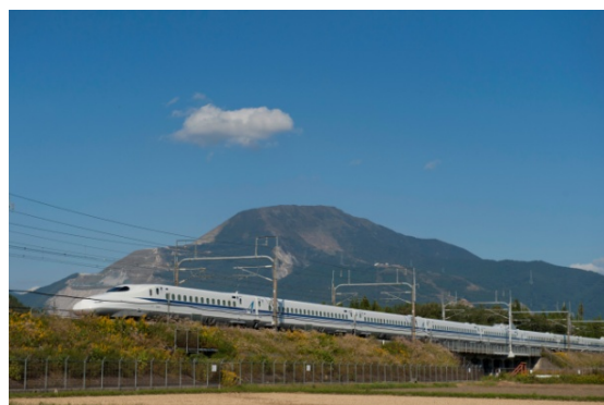
伊吹山をバックに走るN700A