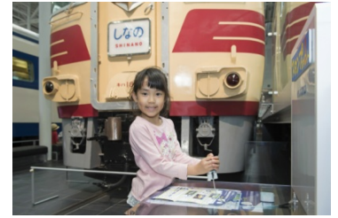
過去のイベントの様子