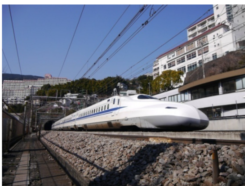
新丹那トンネルから進出するN700系