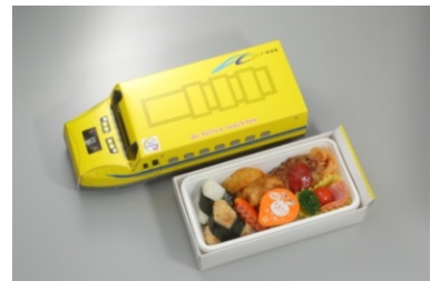
Dr. Yellow lunch box