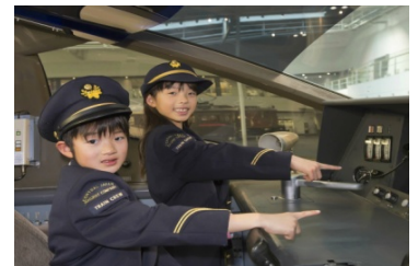
過去のイベントの様子