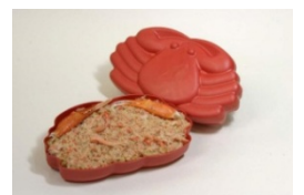
山陰鳥取かにめし