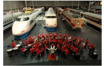
JR東海音楽クラブ 過去のコンサートの様子

イベントの参加方法など詳しくは3月中旬より「リニア・鉄道館」のホームページ ( http://museum.jr-central.co.jp )でご案内します。