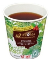
ベレテ森林コーヒー

各フェアの開催期間など、3月中旬以降詳しくは「リニア・鉄道館」のホームページ ( http://museum.jr-central.co.jp ) をご覧ください。