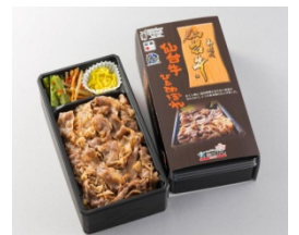
仙台牛ひとめぼれ