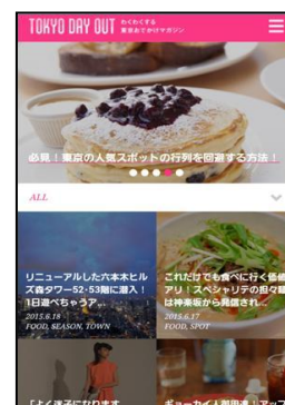
TOKYO DAY OUT 画面とライター