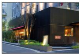
ホテルモントレ半蔵門