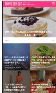
TOKYO DAY OUT 画面とライター