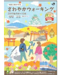
専用パンフレット(イメージ)