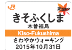
駅名バッジ(イメージ)

10 月に、秋彩る木曽地区の紅葉が楽しめる 2 コースを「Shupo[シュポ]」キャンペーン連動コースとして開催します。 このコースでは、春でもご好評頂きました各コースのスタート駅の「駅名バッジ」を先着でプレゼントするほか、地元からのプレゼントもあります。