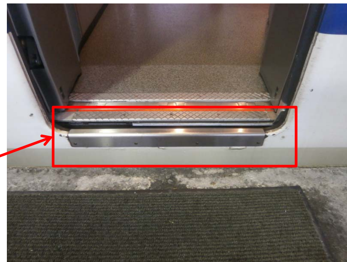
正常な取り付け状態