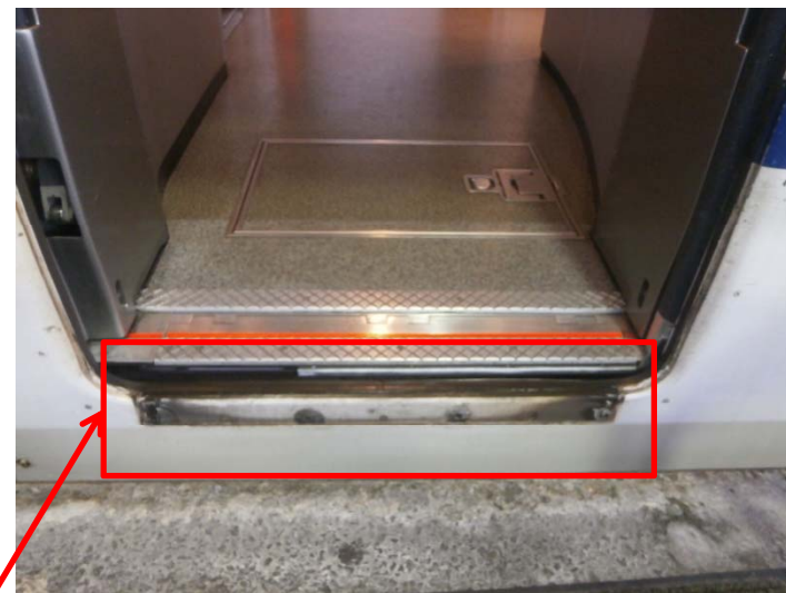
落失した状態(当該車両)