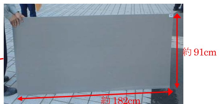
プラスチック段ボール