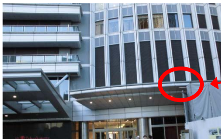
2階タワーズテラス