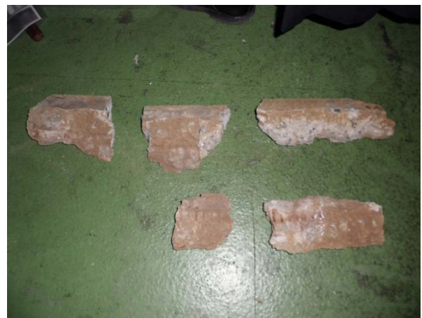
落下していたモルタル片