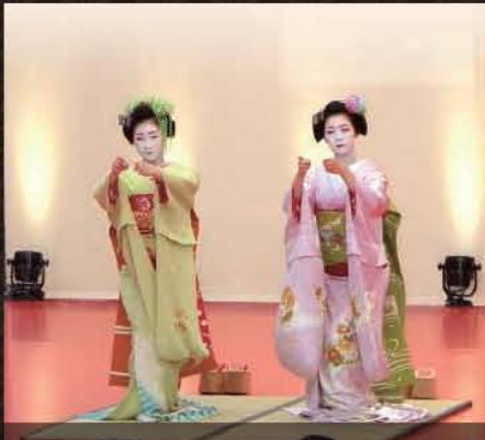
舞妓さんによる舞の披露