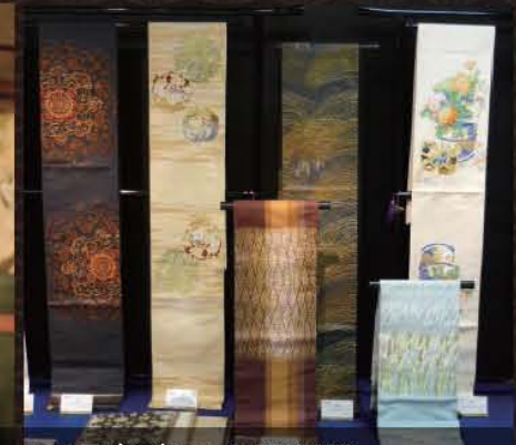
高島屋プレゼンツ 龍村美術織物 錦帯特別展示