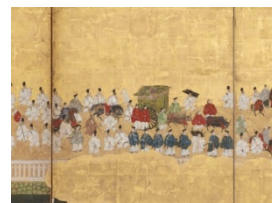
二条城行幸図屏風 右隻 部分 1/26~2/21 出陳予定 京都国立博物館