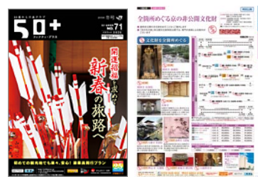
50+ 京の冬の旅プラン

※50+商品のため、50+への会員登録が必要です。詳しい入会条件や旅行条件をジェイアール東海ツアーズ50+Webサイト ( http://jr50plus.jp/ ) で事前に確認の上、お申し込みください。