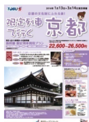
東武トップツアーズ