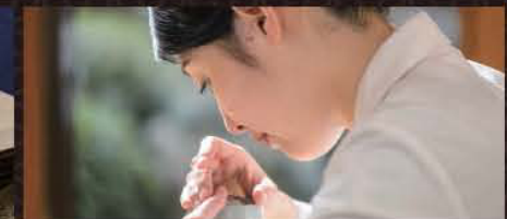
高島屋プレゼンツ 山田松香木店 特別販売&体験コーナー (ミニ煎香体験・句作り体験)