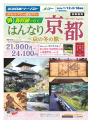
近畿日本ツーリスト