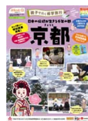
親子で行く修学旅行 (京の冬の旅編)

「歴史上の人物ゆかりの地と伝統文化を体験」と「日本の禅を学んで昔からの技術を見る」の2つをテーマに2種のコースが展開されています。「京の冬の旅」特別公開の建仁寺開山堂や東寺五重塔を、解説付きで見学をします。また、京菓子づくり体験や京都国立博物館での学芸員による講座付き鑑賞などの親子で楽しめる特別授業でいっそう学びが深まります。