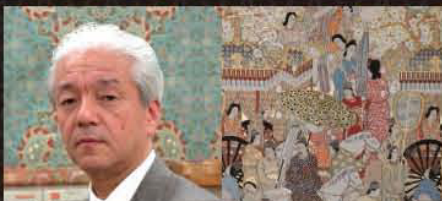
高島屋プレゼンツ 龍村美術織物 四代 龍村平蔵トークショー