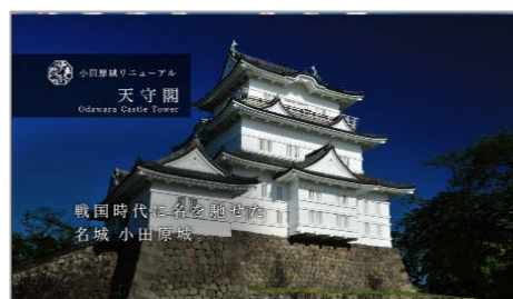
小田原 プロモーション動画