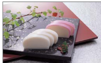
かまぼこ（鈴廣蒲鉾）