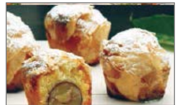
パリパリ焼きモンブラン（菜の花）