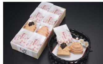
小田原城もなか（風月堂）