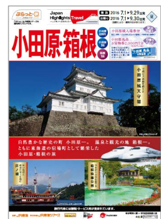
パンフレット表紙

詳細は「Japan Highlights Travel」ホームページ ( http://japan-highlightstravel.com/ ) をご覧ください。