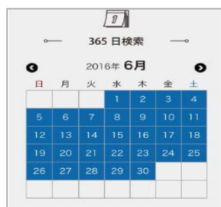
365days of 東海道