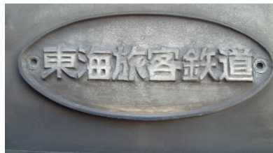
例：JR東海特賞(700系車両の車両銘板) 3名様 ※JR東海銘板と製造会社銘板のセットです。

取得したポイントに応じて、鉄道グッズのプレゼントに応募ができ、抽選で当たります。例えば、「JR東海特賞」では東海道新幹線の車両銘板が当たります。