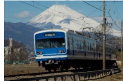
伊豆箱根鉄道(駿豆線)