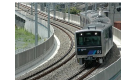
名古屋臨海高速鉄道