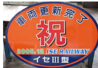
例：伊勢鉄道特賞(ヘッドマーク) 1名様

ポイントラリーの詳しい遊び方やルール、プレゼントの内容・応募期間等の詳細は、アプリにてご確認ください。