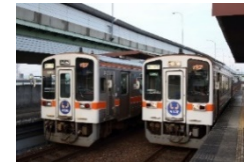
東海交通事業城北線