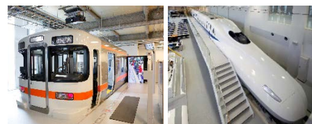
各種訓練設備を活用して、運転士や車掌等の業務を体験（総合研修センター）