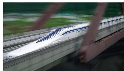
超電導リニア L0系（山梨実験線）