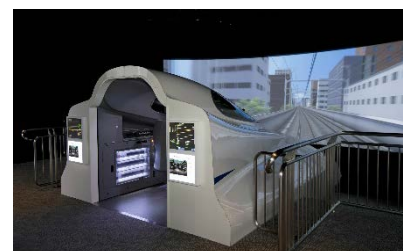
新幹線シミュレータ「N700」（リニア・鉄道館）