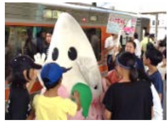
昨年のゆるキャラお出迎え (伊那市駅)