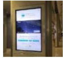
名古屋駅デジタルサイネージ