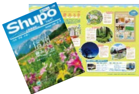
【夏 shupo パンフレット】

長野県が掲げる4つのチャレンジ「おもてなし県民運動」に連動して、中央線、飯田線沿線の皆様と連携したおもてなしを実施します。夏の信州でしか味わえない、特別な観光列車とおもてなしに是非ご期待ください。