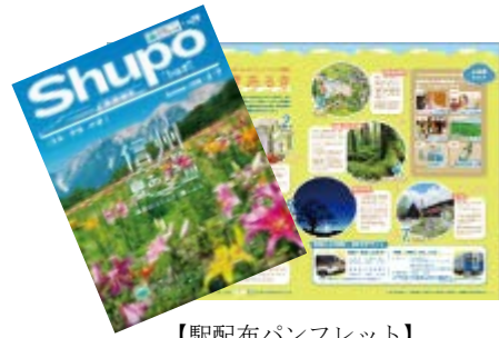
【駅配布パンフレット】

今夏のキャンペーンは「信州夏あるき」をテーマとして、上伊那、南信州、木曾、白馬等を中心とした信州の魅力を発信するパンフレットを名古屋地区、東京地区、静岡地区、大阪地区のJR東海の主な駅（一部を除く）で配布します。