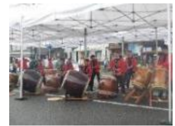
昨年の和太鼓演奏の様子（南木曽駅）