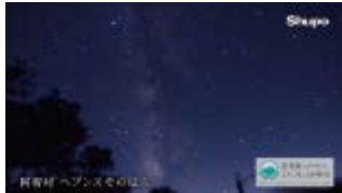
ヘブンスそのはら (阿智村)