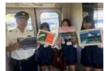
昨年の観光アテンダントと乗務員