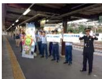
昨年のお出迎えの様子(木曾福島駅)