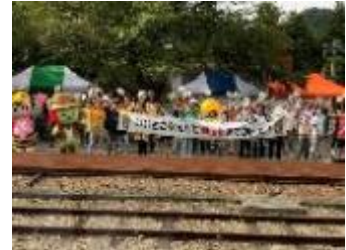
昨年のお出迎えの様子 (平岡駅)