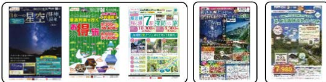
ジェイアール東海ツアーズ