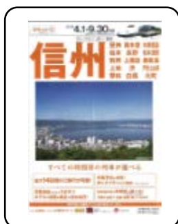
ジェイアール東海ツアーズ