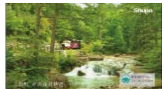
赤沢森林鉄道 (上松町)