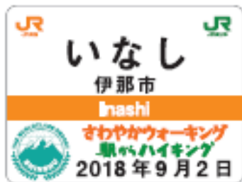
9月2日伊那市バッジ