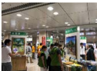
昨年イベントの様子