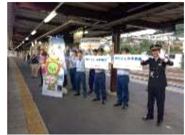
昨年のお出迎えの様子（木曽福島駅）