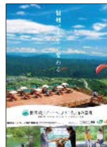
ポスター (実行委員会)