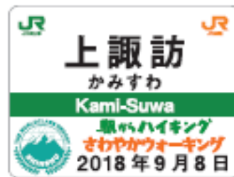
9月8日上諏訪駅バッジ