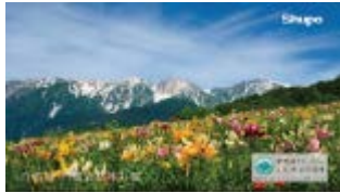
岩岳ゆり園 (白馬村)