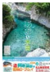
【木曾観光連盟・木曾町・大桑村】