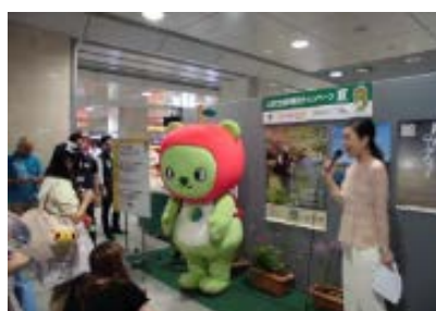
昨年イベントの様子