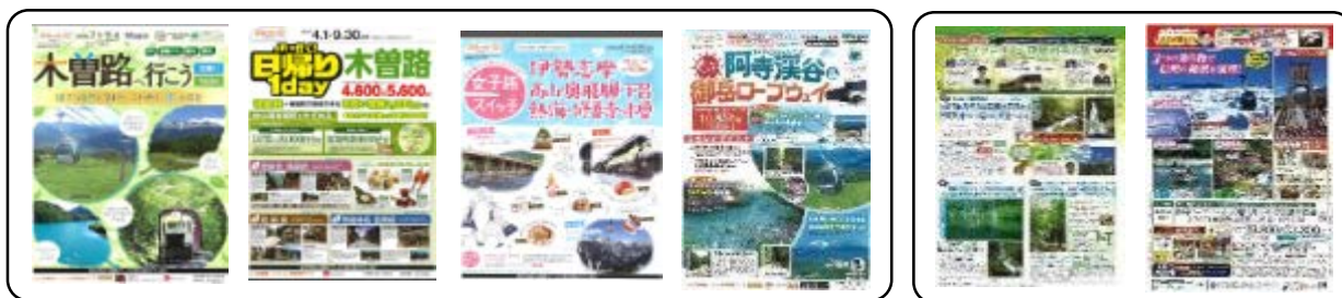
ジェイアール東海ツアーズ