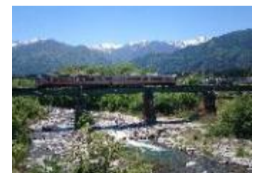
大田切川橋梁付近のイメージ