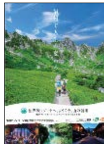
ポスター (実行委員会)