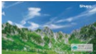
千畳敷カール (駒ヶ根市・宮田村)