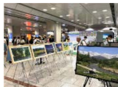
昨年イベントの様子