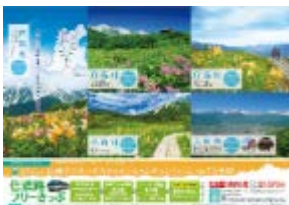
【白馬村・小谷村・大町市】