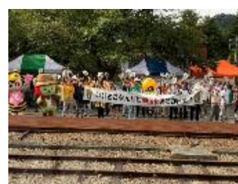
昨年のお出迎えの様子(平岡駅)