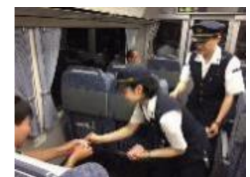
昨年の手作り記念乗車証配布の様子