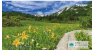
梅池自然園 (小谷村)