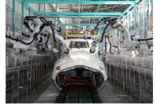
先頭車研ぎロボットの实演