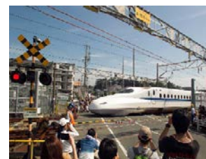
東海道新幹線唯一の踏切