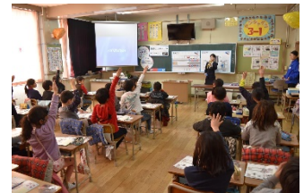
超電導リニアのしくみ授業の様子