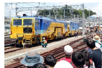
保守用車両の展示及び実演