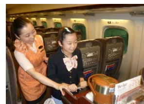
パーサーお仕事体験