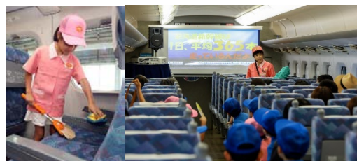
早ワザ！ピカピカ！新幹線車内清掃体験