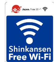
「Shinkansen Free Wi-Fi」 ステッカー