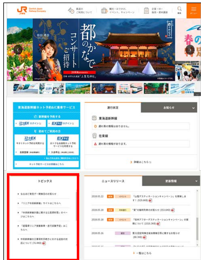
ホームページのご案内イメージ