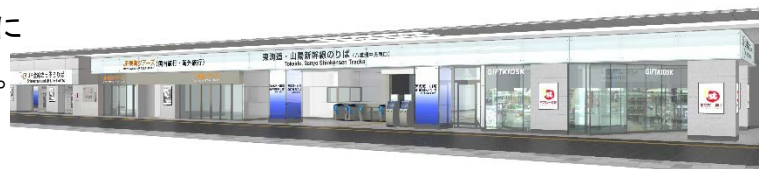
きっぷうりば 新幹線改札 物販店