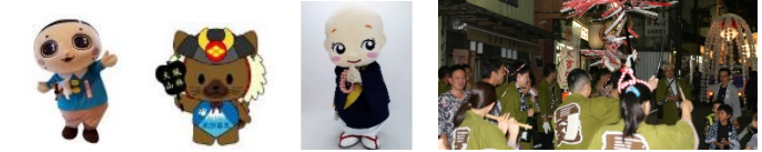
もーん父さん 武田菱丸 こぞうくん 万灯囃子