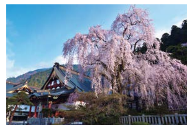
身延山久遠寺 しだれ桜