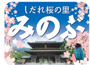
特製ヘッドマーク