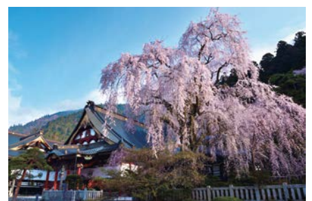
「身延山久遠寺のしだれ桜」