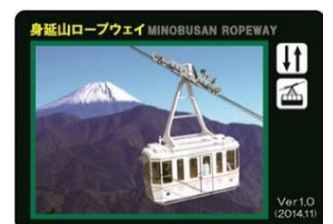
ロープウェイカード(イメージ)