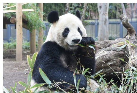
上野動物園「シャンシャン」