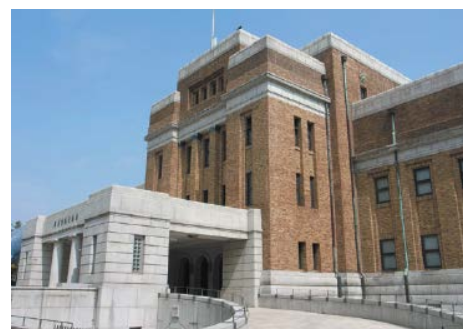
国立科学博物館・外観