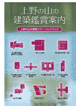
冊子「上野の山の建築鑑賞案内」表紙

・【受取方法】上野マルイ（2階「UENO Information Center」）にて、「トーキョーブックマークで来た！」と一言添えて「上野ウェルカムパスポート」をご提示いただいた方に差し上げます。（無くなり次第、終了いたします。）