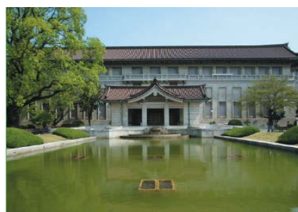
東京国立博物館・外観