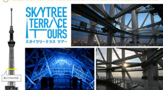
上記3枚:スカイツリーテラスツアー(イメージ)

結婚運・縁結びに良いとされる南東方向に向かってご縁を運んでくる風を感じながら縁祈願！