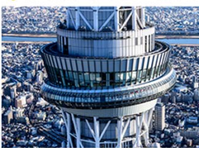
東京スカイツリー天望回廊 (イメージ)