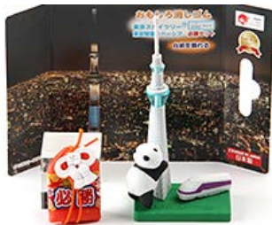
オリジナルグッズ

その他、お手軽にスカイツリーを楽しみたい方にお勧めの「東京スカイツリー開業7周年記念パワースポットプラン」もあります。プラン内容は、下記2点です。