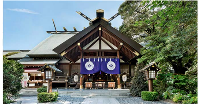
東京大神宮(イメージ)

「東京のお伊勢さま」と親しまれる神前結婚式創始の神社。恋のパワースポットとしても人気がある縁結びの神社です。