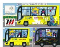
オリジナルステッカー (イメージ)