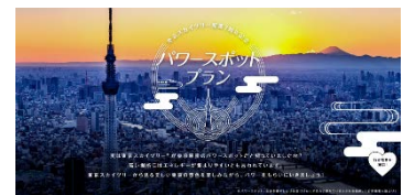
専用サイト イメージ

昨今、都内屈指のパワースポットとして知られる東京スカイツリー。開業7周年記念となる今年は、東京スカイツリーに加え、都内のパワースポットを選んで巡ることができるトーキョーブックマーク限定の特別プランをご用意しました。