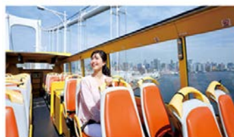
はとバスオー・ソラ・ミオ (イメージ)

東京各所の重要なエネルギー(気)をシンプルに必要なだけ取り込みたいときには、はとバスを利用するのがベスト！