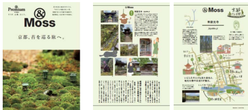
「&MOSS 京都、苔を巡る旅へ。」ガイドブックイメージ