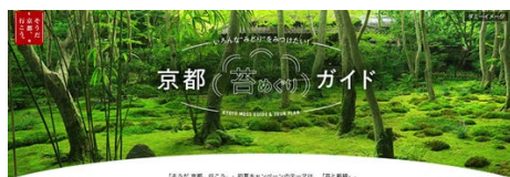
「京都の苔めぐりガイド」ページイメージ

京都の初夏の旅行情報を始め、苔の美しいスポットを「苔MAP」と動画でご紹介します。また、例年多くの方にご覧いただいております「青もみじ情報」ページも現在更新中です。