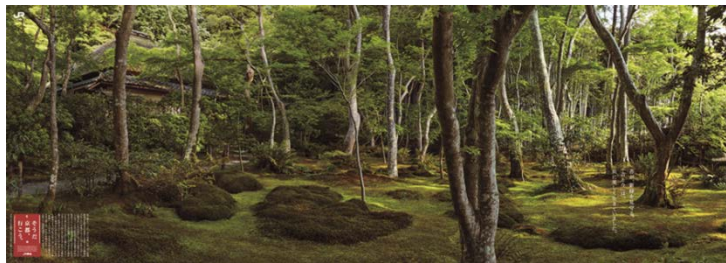
B0×2ポスター<苔と新緑編> (イメージ)

祇王寺と常寂光寺を取り上げます。一面の苔と青もみじに柔らかく包まれた初夏の情景をメインビジュアルに据え、美しい写真と映像でお伝えします。