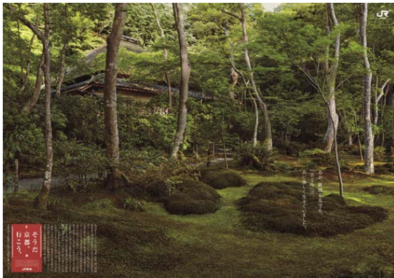
B0ポスタービジュアル（祇王寺）