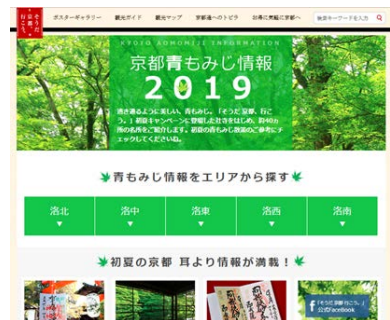
「青もみじ情報」ページイメージ