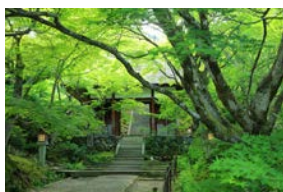
常寂光寺と苔テラリウムイメージ