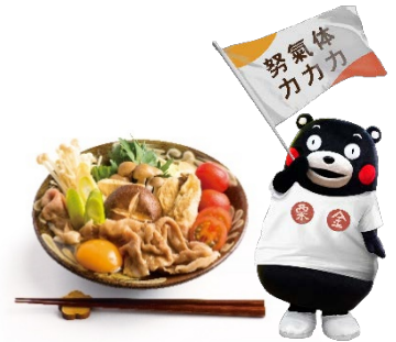
オリジナルメニューのイメージ