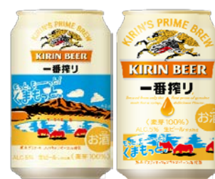
デザインイメージ