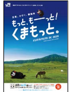
ガイドブック表紙

各エリアの観光情報やキャンペーン期間中に開催されるＤＣ特別企画、イベント情報などを掲載した熊本ＤＣガイドブック約４０万部を、全国のＪＲ主な駅や旅行会社窓口を中心に配布します。