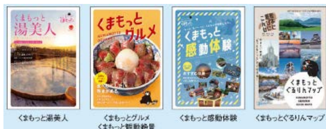
ガイドブック表紙