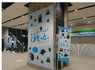
バナー・のぼり旗イメージ

熊本DCの開催期間中、熊本駅の駅コンコースなどでは、熊本DCのバナーやのぼり旗、フラッグなどを設置するほか、JR九州の主な駅ではミニのぼり旗を設置します。