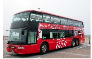
レストランバス外観