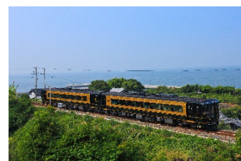
特急「A列車で行こう」