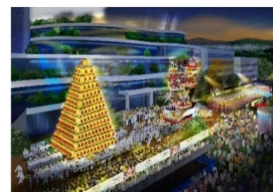
メイン会場イメージ