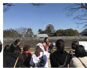
ガイドツアーのイメージ