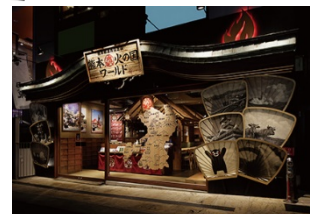
熊本火の国ワールド （協力店舗の一例）