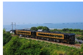
特急「A列車で行こう」