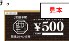
見本 ショッピングチケット イメージ