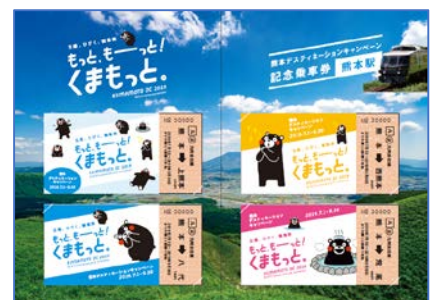
中面デザインイメージ