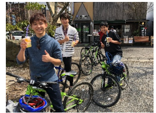
たベコギのイメージ