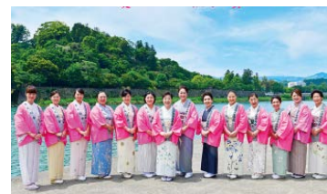
人吉温泉さくら会