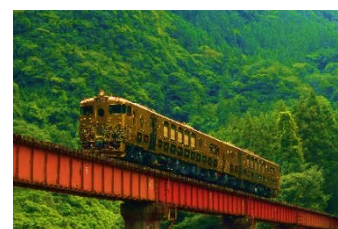
「或る列車」運行イメージ

熊本DC期間中、豪華スイーツコースで大人気の「JRKYUSHU SWEET TRAIN『或る列車』」が、豊肥本線大分駅～阿蘇駅間を特別運行します。