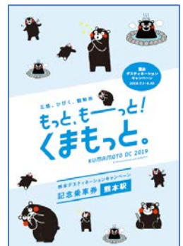
表紙デザインイメージ