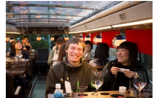
レストランバス車内イメージ