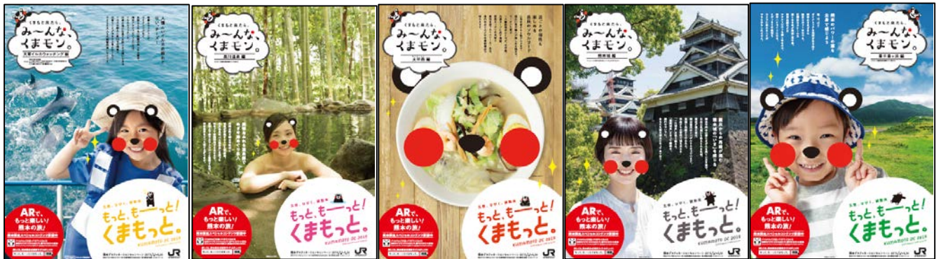
(A) 天草イルカウォッチング

熊本県が制作した5連貼りポスターを、2019年6月1日（土）～30日（日）の間、全国のＪＲ主な駅に掲出します。ＤＣガイドブックでも紹介する、スペシャルコンテンツのＡＲカメラ“ＣＯＣＯＡ Ｒ２”の活用をイメージしたポスターです。