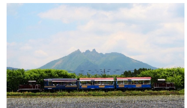
南阿蘇鉄道「ゆうすげ号」

○設定期間：土曜、日曜、祝日及び2019年7月20日（土）から9月1日（日）の毎日