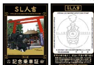
特別記念乗車証イメージ