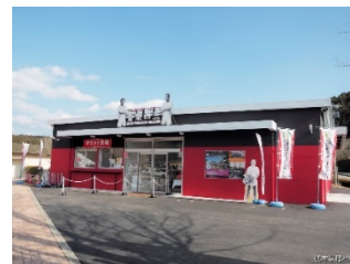
金栗四三ミュージアム