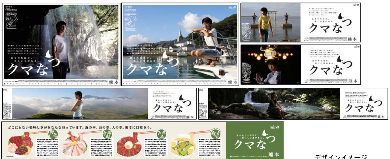
デザインイメージ

今回のポスターのタイトルは「クマなつ」です。熊本の夏を満喫するデザインとなりました。 (掲出時期) 2019年5月24日（金）～9月30日（月）まで全国のＪＲの主な駅・車内等に掲出。