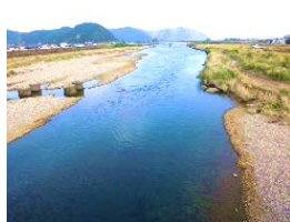
ちようしうがわ 銚子川