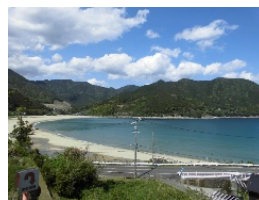
あたしかわいがん 新鹿海岸