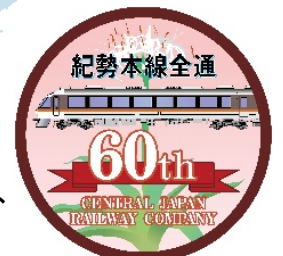
記念ロゴマーク (記念列車ヘッドマーク)

紀勢本線の駅員・乗務員からデザインを募集し、ワイドビュー南紀と沿線に自生するハマユウをあしらった記念ロゴマークを作成しました。6月13日（木）～8月31日（土）まで、紀勢本線の駅員・乗務員がこのロゴマークのピンバッジを着用し、お客様をおもてなしするほか、記念列車のヘッドマーク等に使用します。