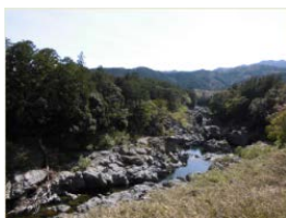
おたききょう 大滝峡