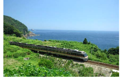
ワイドビュー南紀