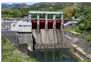
みせだに 三瀬谷ダム