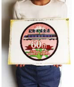
最後の開通区間 乗車証明書・乗車記念ステッカー