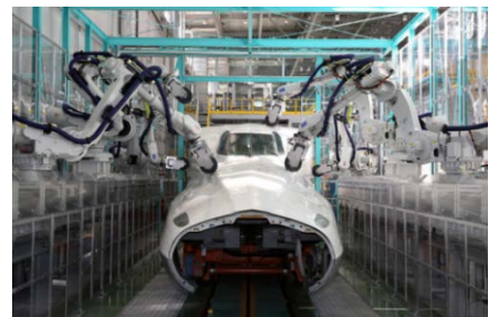
先頭車研ぎロボット