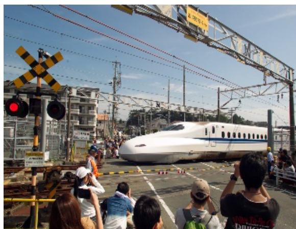
東海道新幹線唯一の踏切