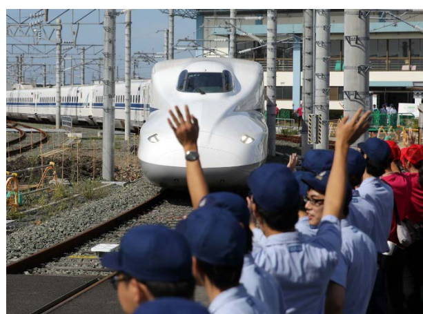
浜松工場に入線する列車をお出迎えする様子