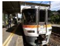
急行「中山道トレイン」