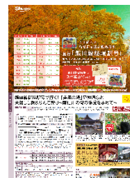
旅行商品の一例 （大鹿村・松川町）