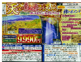
旅行商品の一例（木曽）