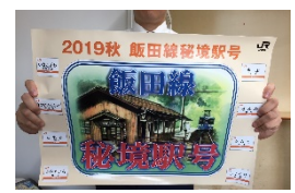
ヘッドマークシール（原寸大）