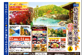
旅行商品の一例（奥飛騨）