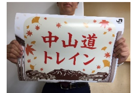
ヘッドマークシール（原寸大）