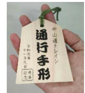
乗車証明書（イメージ）