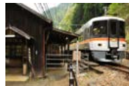
急行「飯田線秘境駅号」