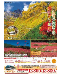
駒ヶ根市・箕輪町