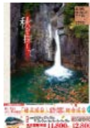
木祖村・南木曽町・大桑村