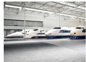
新幹線車両の展示