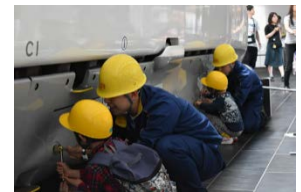
過去のお仕事紹介の様子