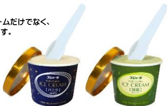
アイスクリームバニラ