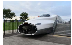
N700系新幹線 前頭オオイ特別開放