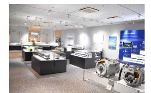
過去の特別展の様子