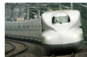
N700系量産先行試作車 (X0編成)