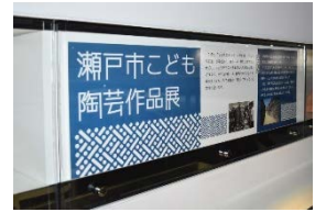
過去の展示の様子