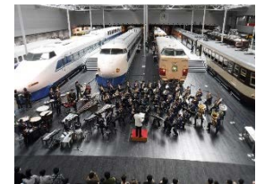
過去のJR東海音楽クラブ コンサートの様子