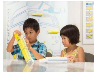
ペーパークラフト工作体験