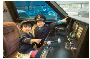
過去の運転台公開の様子