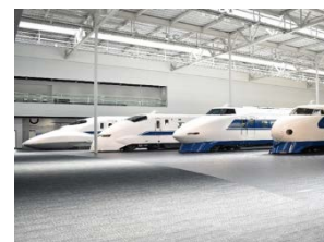
新幹線車両の展示