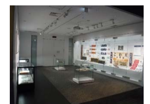
過去の特別展の様子