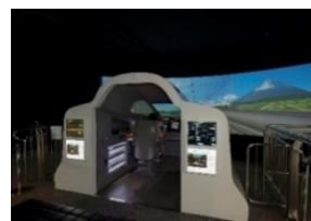
新幹線シミュレータ「N700」