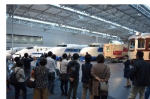
過去のみどころガイドの様子