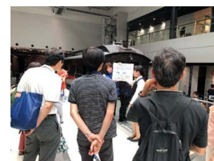
過去のガイドツアーの様子